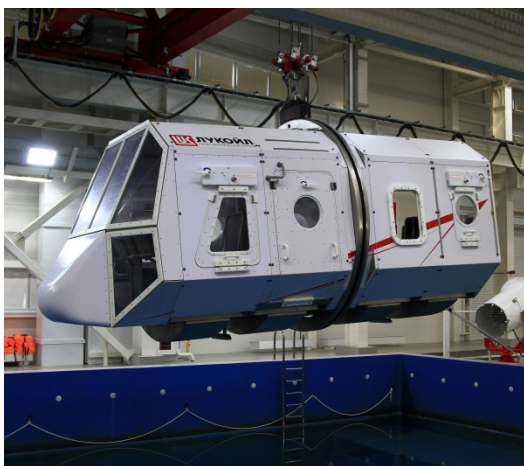
Рисунок 1 – Внешний вид погружного макета вертолета